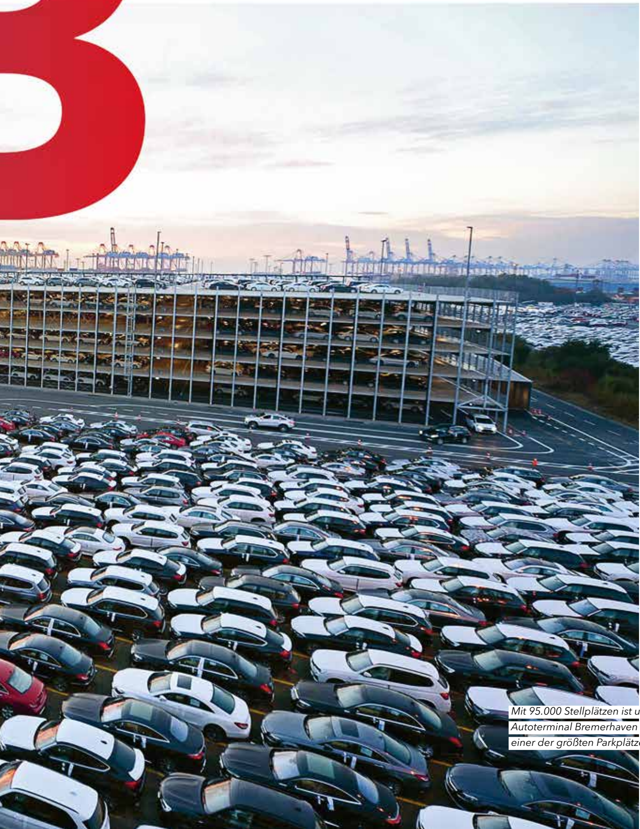
Mit 95.000 Stellplätzen ist unser Autoterminal Bremerhaven (ATB) einer der größten Parkplätze der Welt.